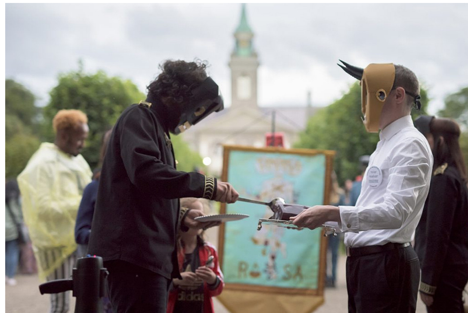
Cvltó do Fvtrv, Irish Museum of Modern Art, Dublin ( 2017 )