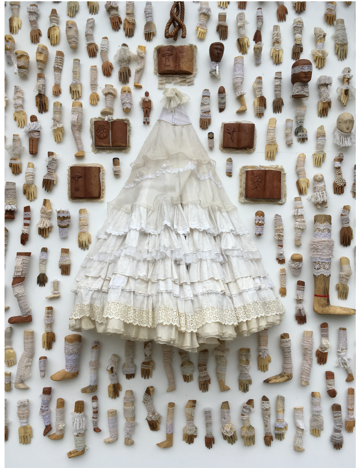
Interventu ( detalhe ), pré-montagem ( 2017 )