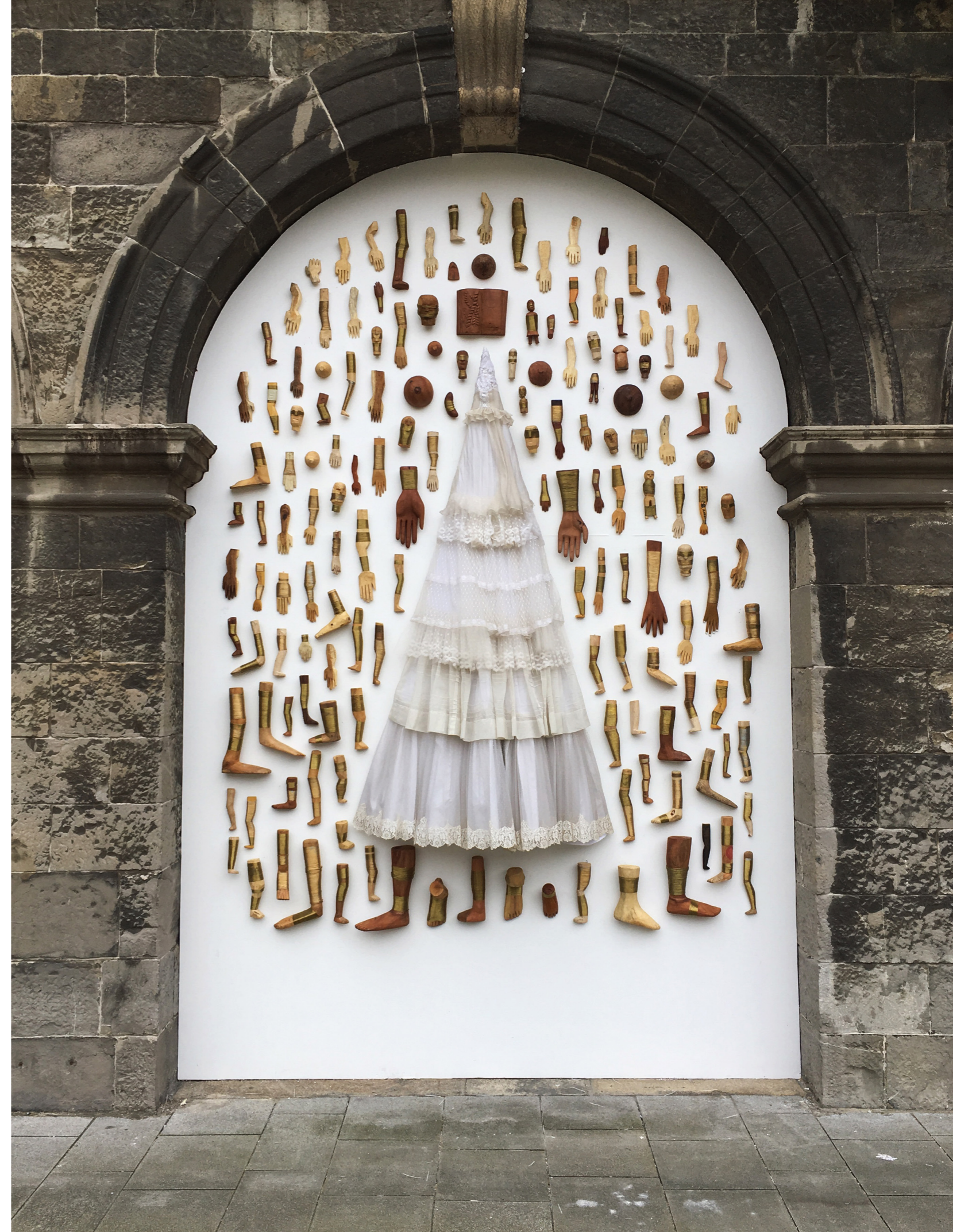
Interventu ( detalhe ), Irish Museum of Modern Art, Dublin ( 2017 )