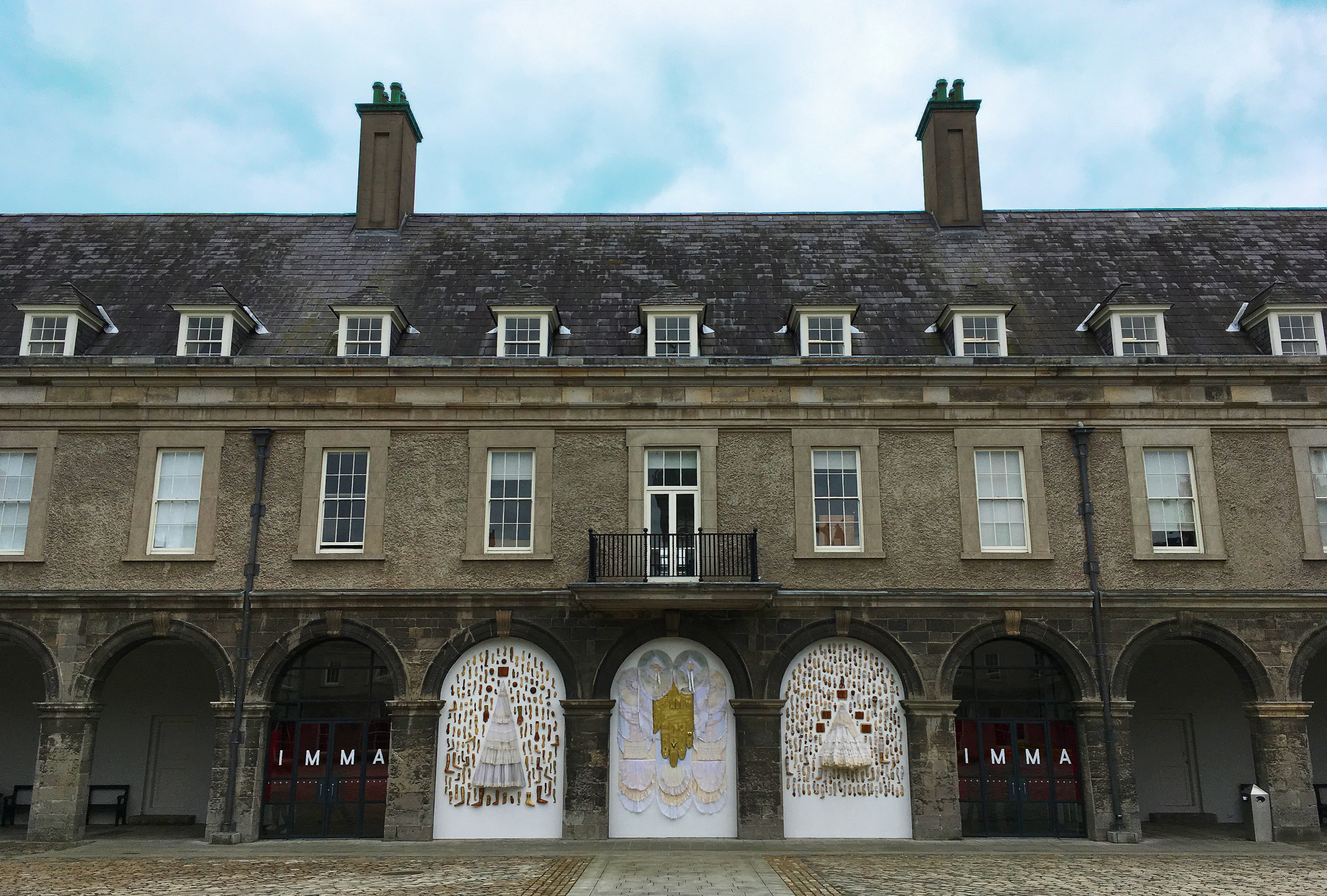
Interventu, Irish Museum of Modern Art, Dublin ( 2017 )