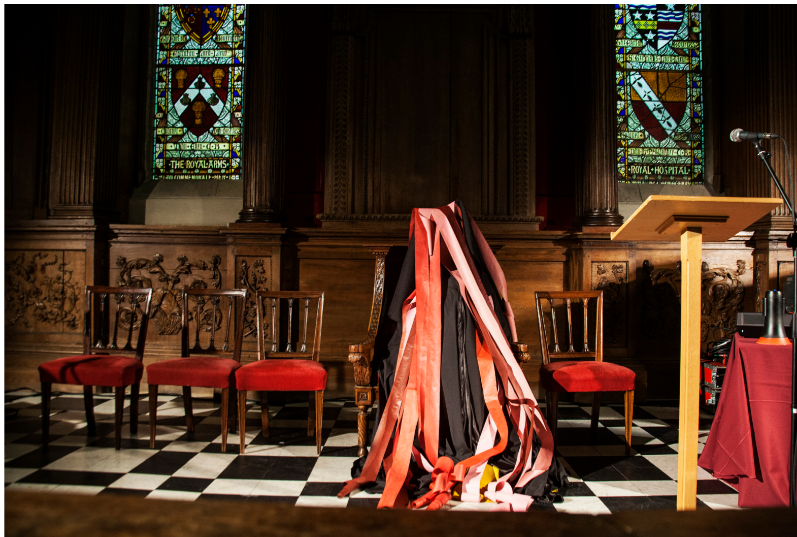
Cvltó do Fvtrv, Irish Museum of Modern Art, Dublin ( 2017 )