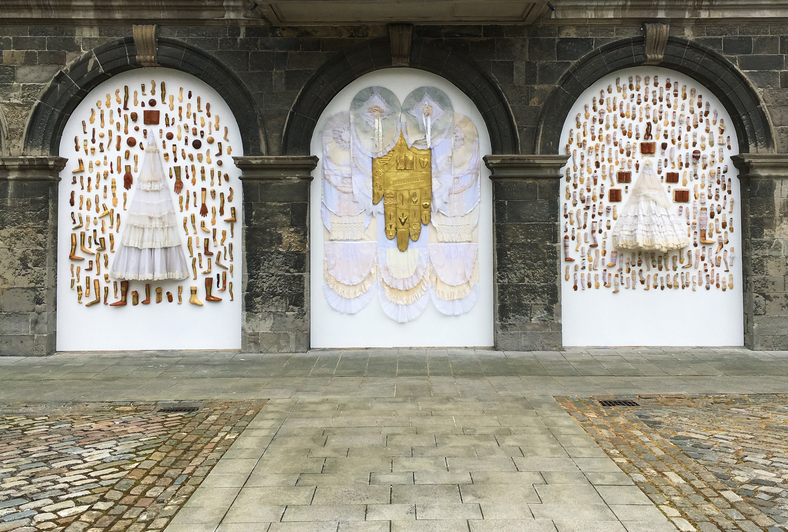
Interventu ( detalhe ), Irish Museum of Modern Art, Dublin ( 2017 )